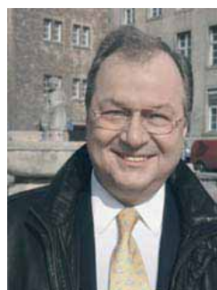
■ Heinz Buschkowsky , Bezirksbürgermeister von Neukölln

Gerne komme ich Ihrer Bitte für die Übernahme der Schirmherrschaft des Wettbewerbes „Migranten gründen – Wettbewerb der Geschäftsideen“ in Neukölln nach. Ich begrüße Ihre Initiative ausdrücklich. Neukölln ist mit über 300.000 Einwohnern eine Großstadt, in der Menschen aus 163 Nationen ihr zu Hause gefunden haben. Das zeigt sich auch und besonders im wirtschaftlichen Bereich, in dem die ethnischen Ökonomien einen wichtigen Wirtschaftsfaktor am Standort Neukölln darstellen. Aus diesem Grund halte ich es für notwendig, potenzielle Gründerinnen und Gründer mit Migrationshintergrund besonders zu unterstützen, die Eigeninitiative im Bezirk zu stärken und eine Verbesserung des Klimas und der Voraussetzungen für Existenzgründungen zu schaffen. Vor allem Jungunternehmer/innen sollten dazu angeregt werden, ihre Ideen in die Praxis umzusetzen und sich selbstständig zu machen.