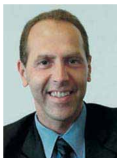
■ Lorenz Postler , Wirtschaftsstadtrat und Stellvertretender Bürgermeister Friedrichshain- Kreuzberg

Ich freue mich, dass der LOK e.V. erneut einen Wettbewerb im Bezirk durchführen wird. Er soll die Leistungskraft ethnischer Ökonomie und junger Menschen mit Migrationshintergrund hervorheben. Ich unterstütze ihr Vorhaben, mit Hilfe des Wettbewerbs die Bedeutung und Leistungskraft ethnischer Ökonomie einem größeren Kreis von Menschen zu vermitteln. Viel zu wenigen ist bekannt, welche große Bedeutung die unternehmerischen Aktivitäten der mehr als 25.000 Berliner Gewerbetreibenden mit Migrationshintergrund für die wirtschaftliche Infrastruktur dieser Stadt und für den Bezirk hat. Für die Zukunft Berlins, aber vor allem für diesen Bezirk mit seiner interkulturell geprägten, überwiegend jungen Bevölkerungsstruktur, ist es von zentraler Bedeutung, dass auch die jungen Menschen mit Migrationshintergrund ihre Potenziale entwickeln können. Der Wettbewerb will Mut machen, dass sie ihre Geschäftsidee skizzieren, sie mit Fachleuten besprechen und sie ggf. mit professioneller Hilfe weiterentwickeln. Leichter wird das für die jungen Menschen durch Vorbilder, die sie motivieren, ihre Ideen zu entwickeln und an sich zu glauben. Ich wünsche mir, dass möglichst viele Vorbilder aus Wirtschaft, Politik, Sport, Musik, Film u.a.m. den Wettbewerb unterstützen. Gern stehe ich Ihnen für den Wettbewerb als Schirmherr zur Verfügung.